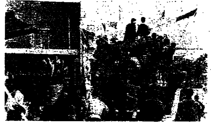
من افلام المهرجان التي عرضت في الثورة لتغير الواقع

استمرارا حثيا مع تيارات مختلفة والواقع على هذه الحقيقة كثيرة - في الشبلي مثلا - والشبه نفسه بالنسبة الى الشركات التجارية الاستغلالية التي تعمل على انتاج افلام غير ملتزمة ببداياتها وخصيصة شياطينها في ذلك جمع اكبر كمية من الربح المادي - وكذلك المؤسسات التابعة للدولة ويسيطر عليها نظام سياسي معين من شأنه قتل الواهب والمبادرات الطيبة - والحيولة دون تطور الفكر وتحول السينما - من تأثير النظم الاستغلالية - فما العمل ان ؟